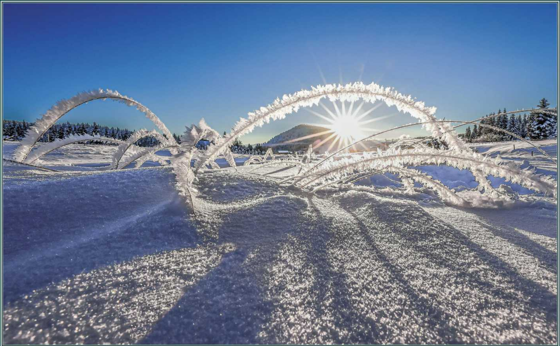
František Lukeš: Svítání na Jizerce