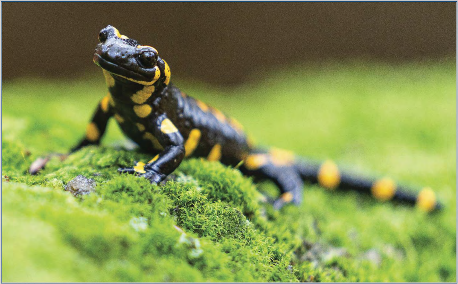
Miroslav Stříbrný: Salamandra salamandra na Viničné