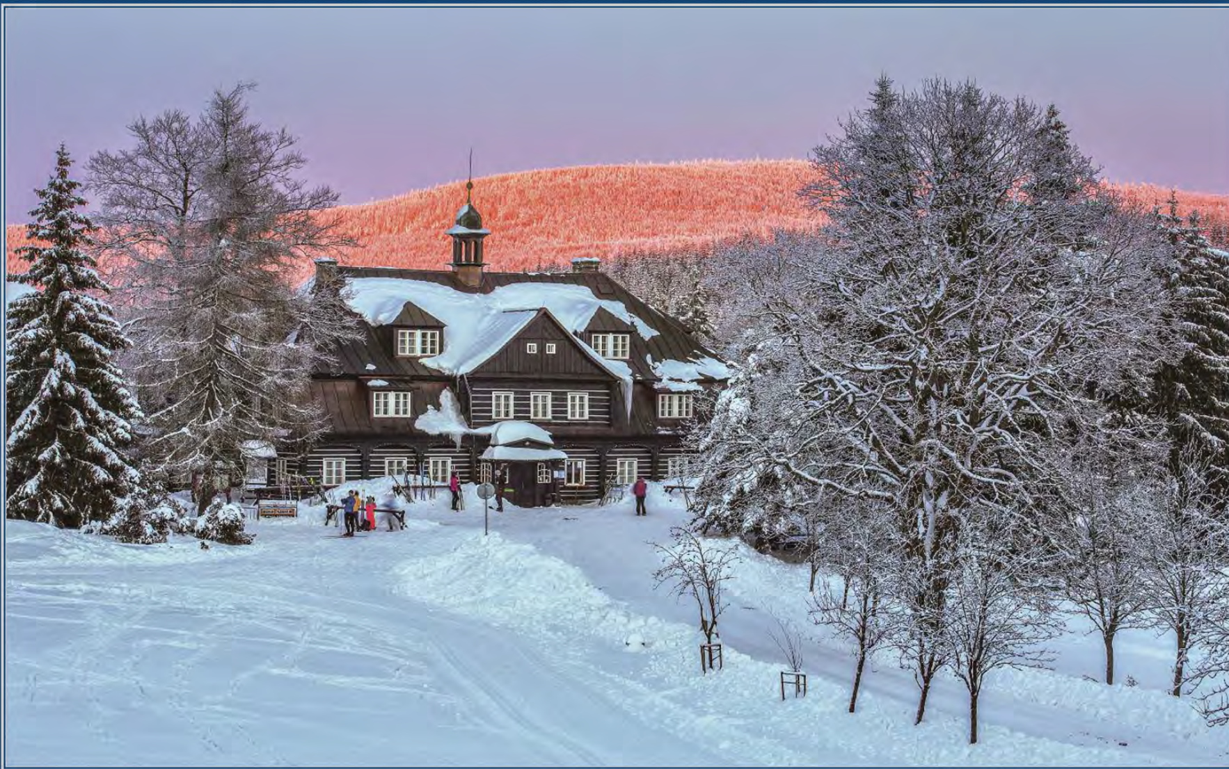
Václav Špetlík: Poslední lyžaři na Šámalce