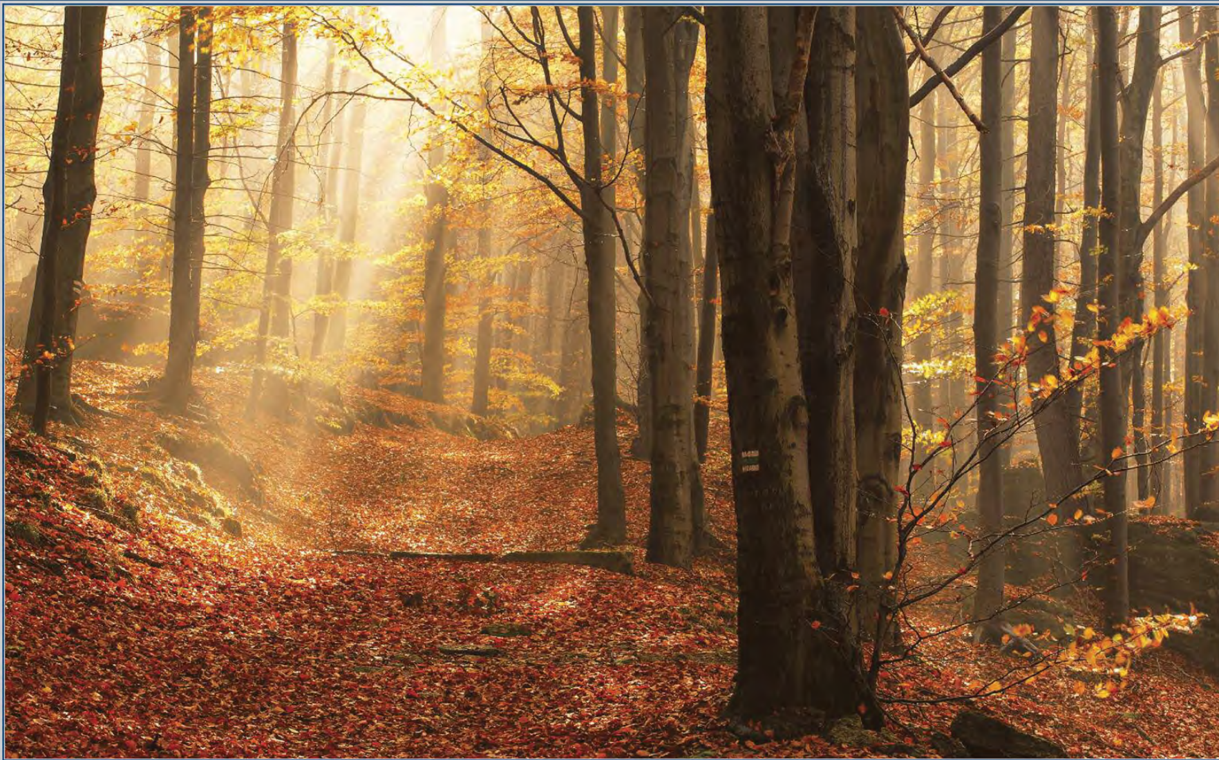
Václav Špetlík: První paprsky