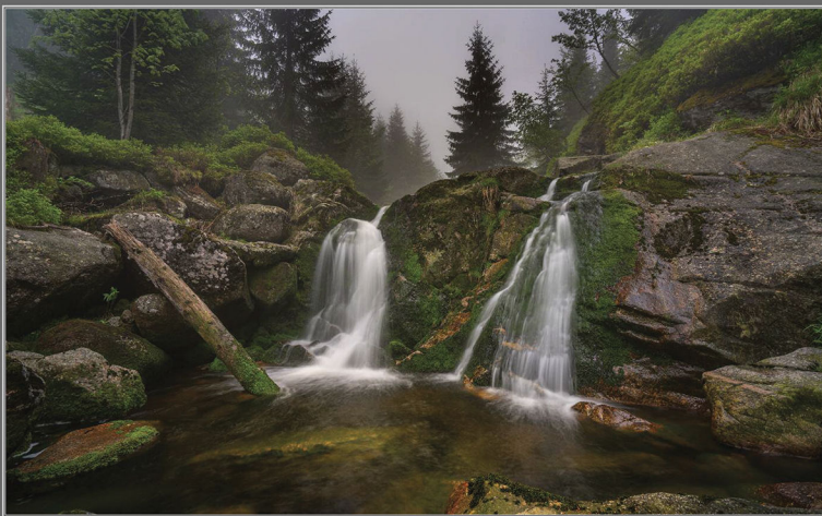
*Rádslav Pelistak: Vodopád na Šmédě