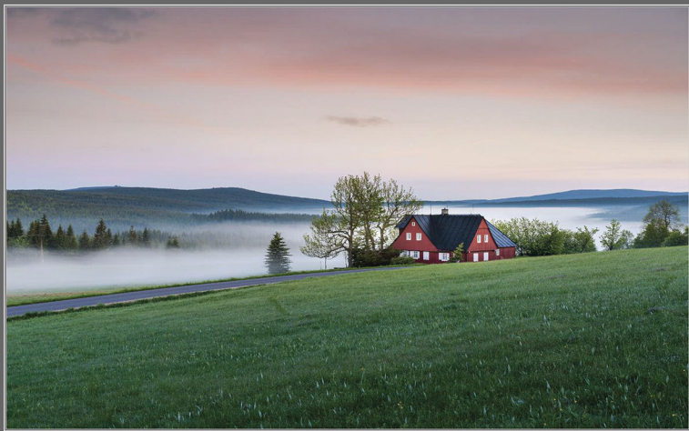
Tomáš Kůpec: Jarní inverze