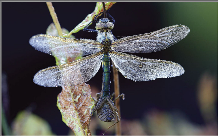
Rgdek Šrupl: Somatochlora metallica