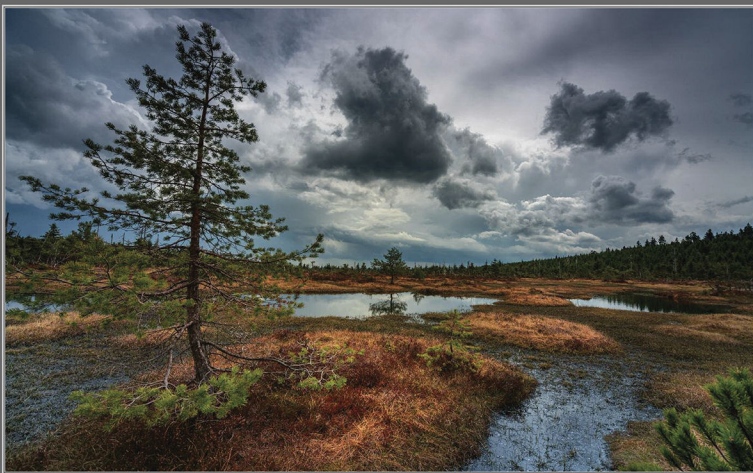
"Radoslaw Peltsiak: Rezervace na Chvadle"