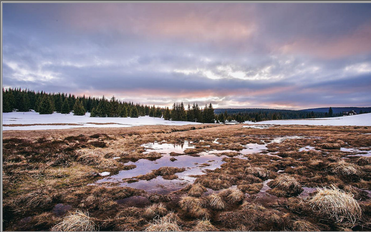
Václav Špetlík: Zryadlení