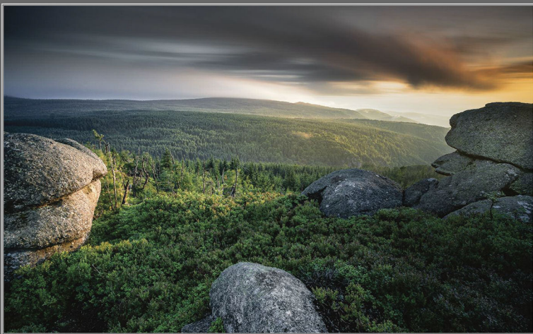
Miroslav Štříbrný: *Polední kameny