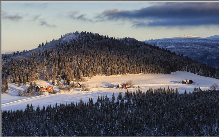
Radek Strupl: Pod Bukovcem