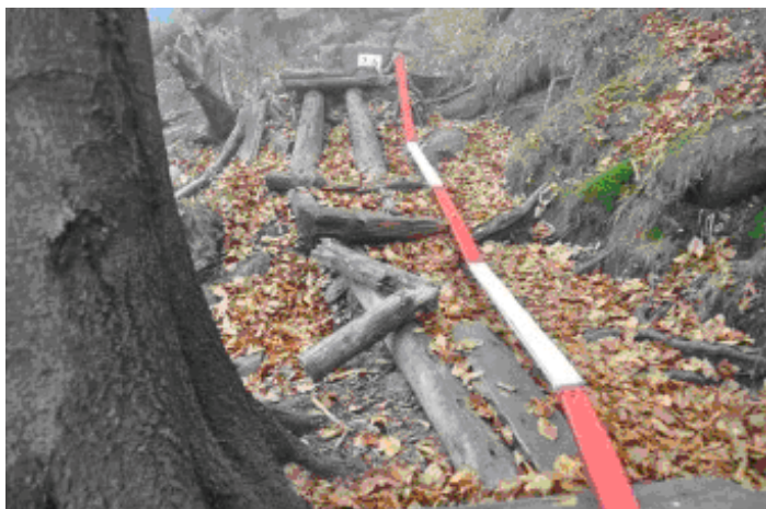
Výstup na Oldřichovský Špičák