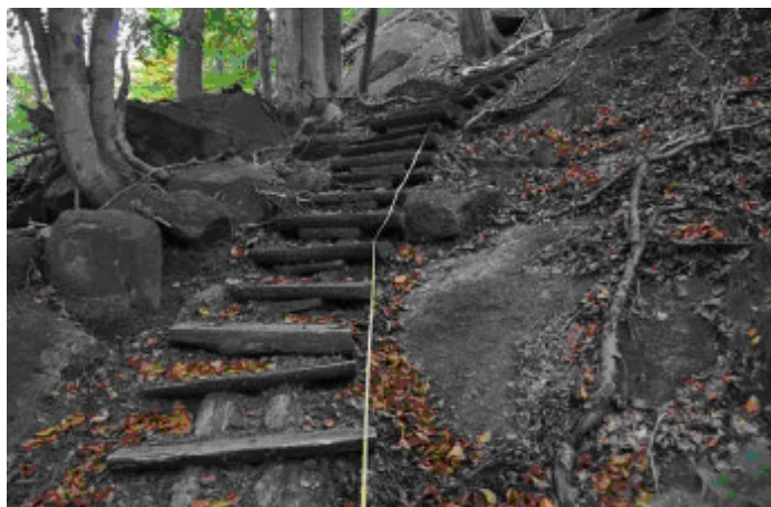
Chodník u lomu Hraničná