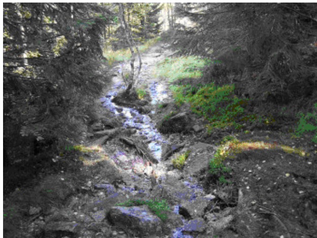
Výstupovka na Paličnick