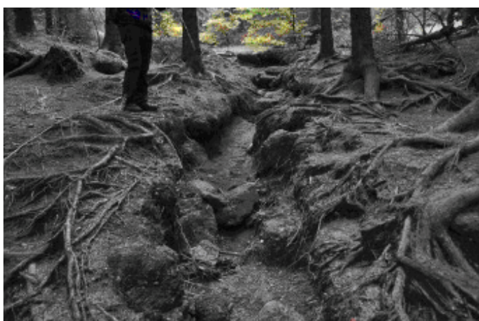
Výstupovka na Ptačí kupy a Holubník