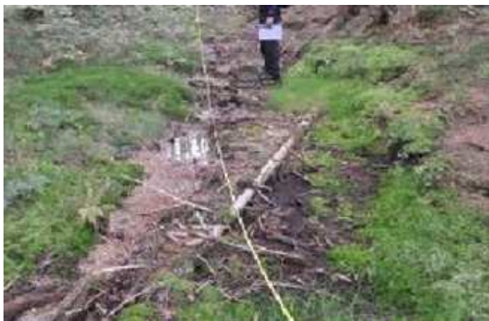
Chodník u lomu Hraničná